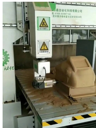
(木工、卫浴、碳纤维等，五轴联动加工，一次性雕刻成型)