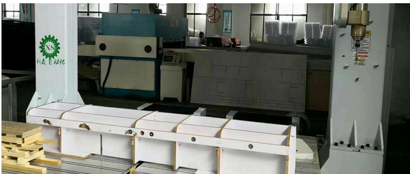
(家装、夹具、冶具等非金属产品，多面加工)