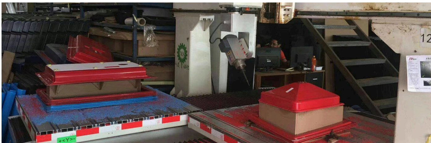
(厚板吸塑，五轴联动加工，一次性成型)