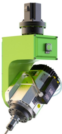
5.5-9KW, 风冷, 意大利进口, 气动换刀 (选配)