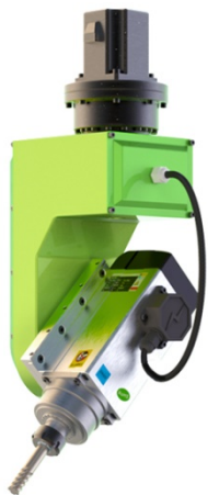
3.7-6.0KW, 风冷, 中外合资, 陶瓷轴承, 超高性价比 (标配)