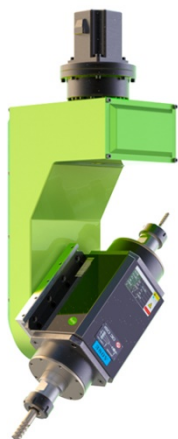
5.5-12KW, 油冷, 意大利进口, 双刀头, 快速换刀 (选配)

风冷: 经济, 无需走线, 制冷差, 噪音大 水冷: 性价比高, 制冷效果好, 有水垢 油冷: 价格贵, 制冷效果非常好, 润滑好, 超静音