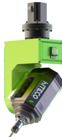
5.5-12KW, 油冷, 意大利进口, 气动换刀, 超静音 (选配)