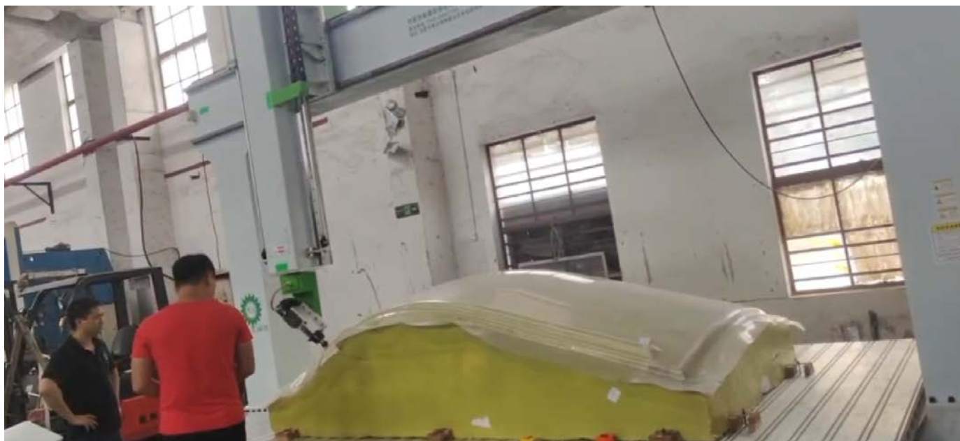
(厚板吸塑, 五轴联动加工, 一次加工成型)