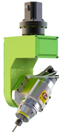
3.2-7.5KW, 水冷, 国产, 静音, 经济 (选配)